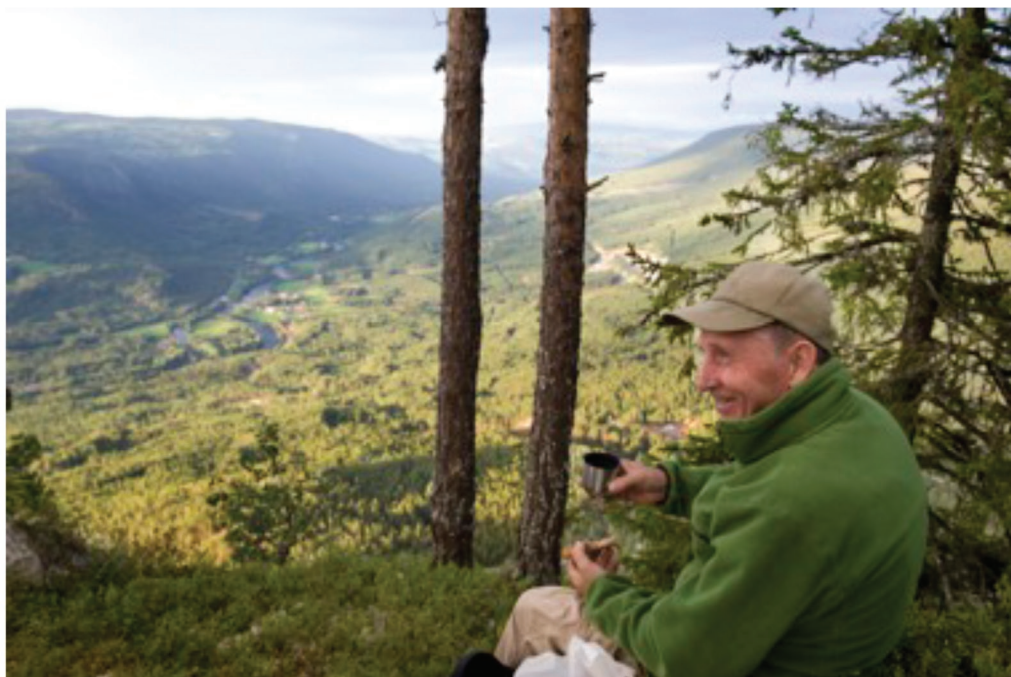
Velfortent rast på toppen.